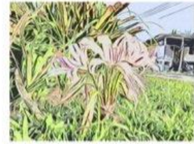
ชื่อผลงาน: พลับพลึงลิบบาน เทคนิค : Monoprint + Woodcut prints ขนาด : 30 x 40 เซนติเมตร