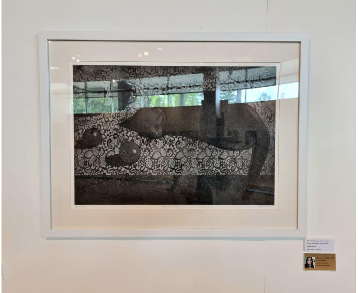
Series: The Space of Memory No. 2 Name: The Space of Memory No. 2 Media: Canvas Year: 2018