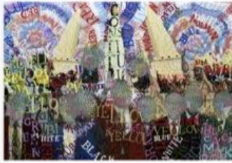
ชื่อผลงาน: ดินแดนสีรุ้งหลากหลาย Name : Rainbow Nation เทคนิค : Photomontage/spray paint ขนาด : 420 x 594 มม.