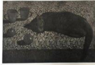
ชื่อผลงาน: The Space of Memory No.3 Name: The Space of Memory No.3 เทคนิค: Etching ขนาด: 60x40 เซนติเมตร